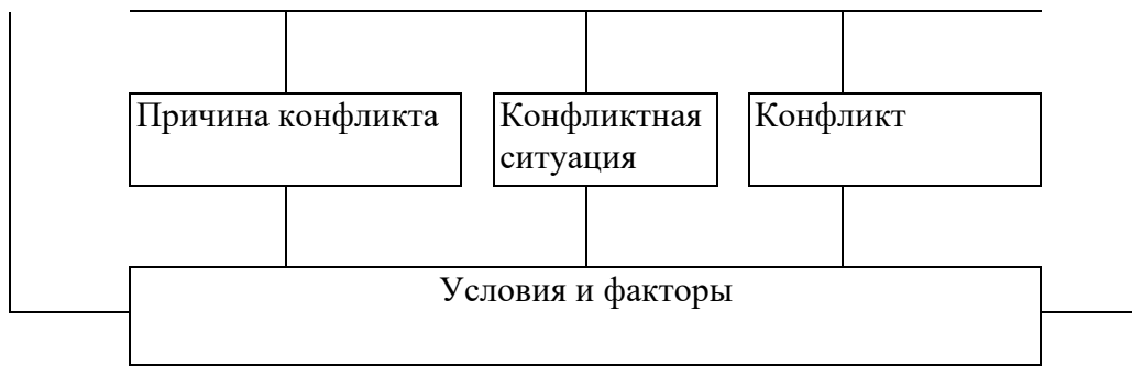
Рис. 2. Соотношение причины конфликта, конфликтной ситуации и конфликта

При этом важно отметить, что особое место среди факторов, обеспечивающих данное соотношение, занимает инцидент, или повод.